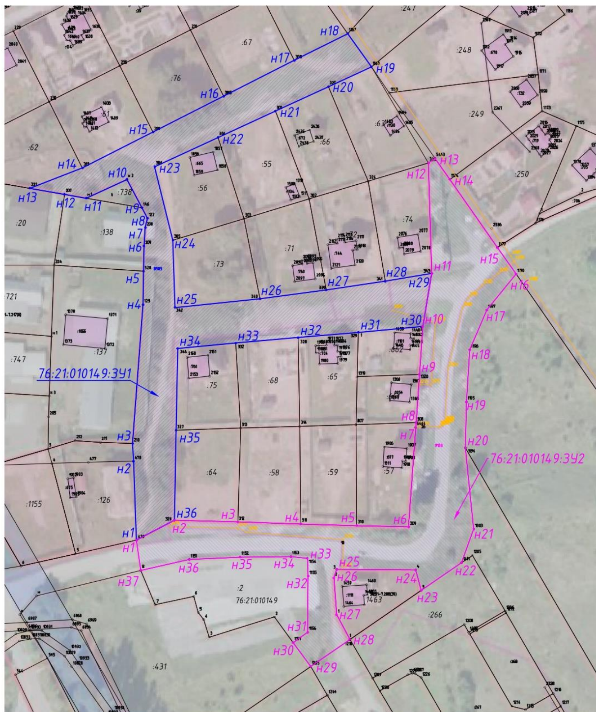
Схема межевания улично-дорожной сети