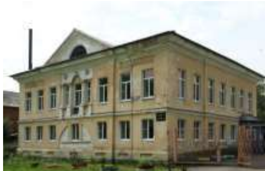
Площадь им. Ленина (бывшая Спасская) – широкий плац в серой плитке