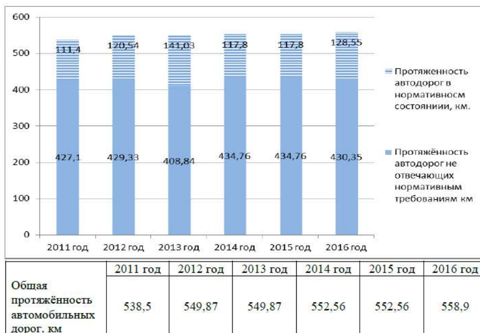
Рис. 2. Протяженность автодорог в Тутаевском муниципальном районе, км

Распределение дорог по принадлежности и соответствие их нормативным требованиям представлено в таблице 6.